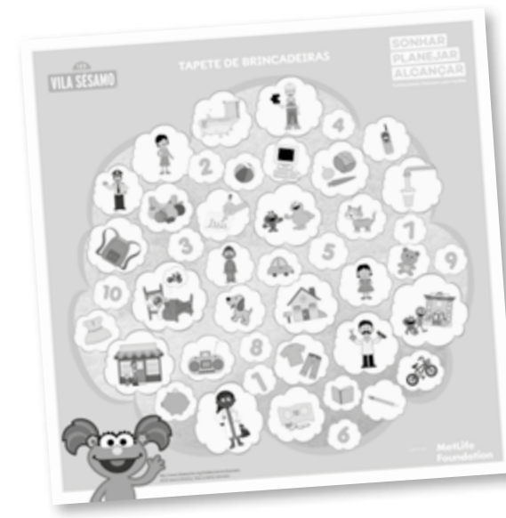
Tapete de Brincadeiras

O tapete é um recurso lúdico que permite envolver as crianças em diversas atividades que as ajudem a identificar sonhos, estabelecer metas, planejar, fazer escolhas e entender sobre necessidades e desejos. Os jogadores podem andar sobre as imagens, identificá-las e descrevê-las, reconhecer formas e cores, contar objetos, montar frases e criar histórias. No encarte que acompanha o tapete são sugeridas algumas vivências lúdicas, mas outras tantas também podem ser inventadas junto com as crianças.