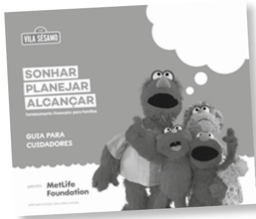
Guia para Cuidadores

O guia para cuidadores é um material desenvolvido especialmente para as famílias e os responsáveis pelas crianças. Há uma série de textos curtos que estimulam os adultos a refletirem sobre fortalecimento financeiro e sobre os exemplos que oferecem às crianças em casa. O material contém dicas e estratégias para as famílias conversarem sobre sonhos, planejamento e gestão do dinheiro. Além disso, sugere atividades divertidas para ajudar as crianças a compreenderem sobre gastos, poupança, partilha, troca e doação.