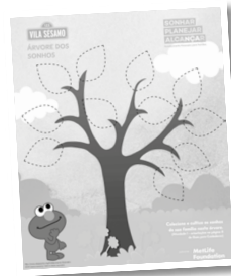
Árvore dos Sonhos

A árvore dos sonhos é um material que ajuda as crianças a visualizarem o futuro, identificarem sonhos individuais e coletivos (materiais e não materiais). Elas podem desenhar nas folhas o que desejam ter, ser ou fazer para elas mesmas ou para a comunidade. Só assim as crianças poderão planejar os passos que as levam a realização dos seus objetivos.