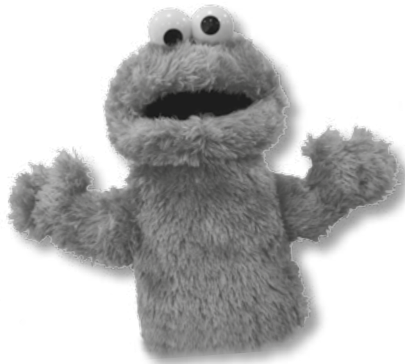
Fantoches do personagem Come Come

Os fantoches são instrumentos que aproximam as crianças dos personagens da Vila Sésamo. Ao mesmo tempo em que divertem as crianças dentro de um ambiente fantástico, eles podem ensinar valores e atitudes fundamentais para o fortalecimento financeiro. Os fantoches também ajudam na construção da identidade da criança, sobretudo quando elas desempenham diversos papéis sociais ao manipulá-los em jogos simbólicos. O educador também pode confeccionar outros bonecos com a sua turma, usando sucata e materiais recicláveis.