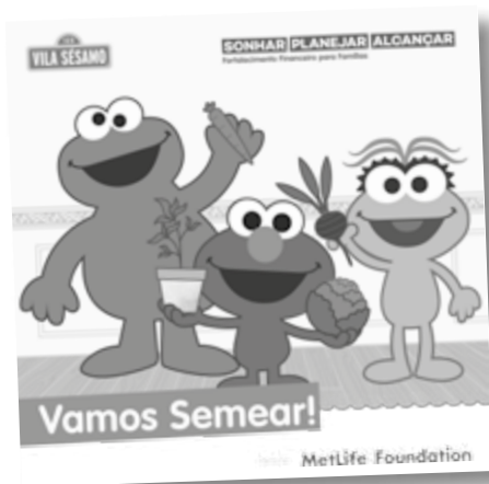
Livro de Histórias

O livro ajuda as crianças a aprenderem como identificar e alcançar seus objetivos, além de aproximá-las do universo mágico da literatura infantil. Na história, as crianças são convidadas a se unirem à família de Elmo para aprenderem como cuidar de uma horta caseira e se alimentar de forma saudável.