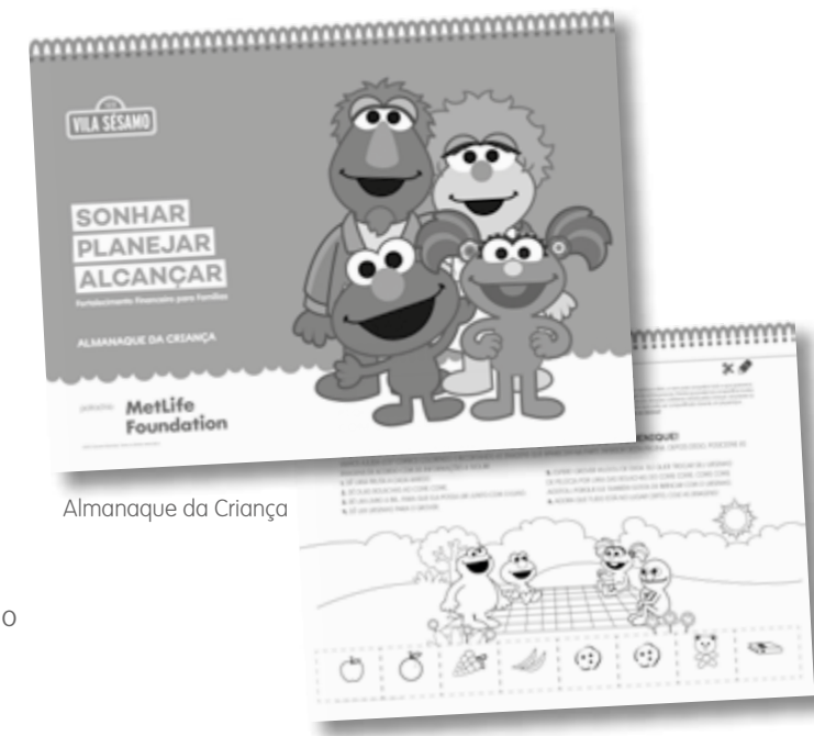
Almanaque da Criança

O almanaque reúne uma série de atividades para as crianças brincarem e se divertirem. Em cada página, há um desafio diferente que estimula o pensamento crítico e a criatividade da criança para alcançar sonhos. No cabeçalho de cada página, há dicas para os cuidadores estimularem reflexões com as crianças, sempre relacionando o conteúdo da atividade ao cotidiano delas.