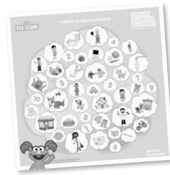
Tapete de Brincadeiras

O tapete é um recurso lúdico que permite envolver as crianças em diversas atividades que as ajudem a identificar sonhos, estabelecer metas, planejar, fazer escolhas e entender sobre necessidades e desejos. Os jogadores podem andar sobre as imagens, identificá-las e descrevê-las, reconhecer formas e cores, contar objetos, montar frases e criar histórias. No encarte que acompanha o tapete são sugeridas algumas vivências lúdicas, mas outras tantas também podem ser inventadas junto com as crianças.