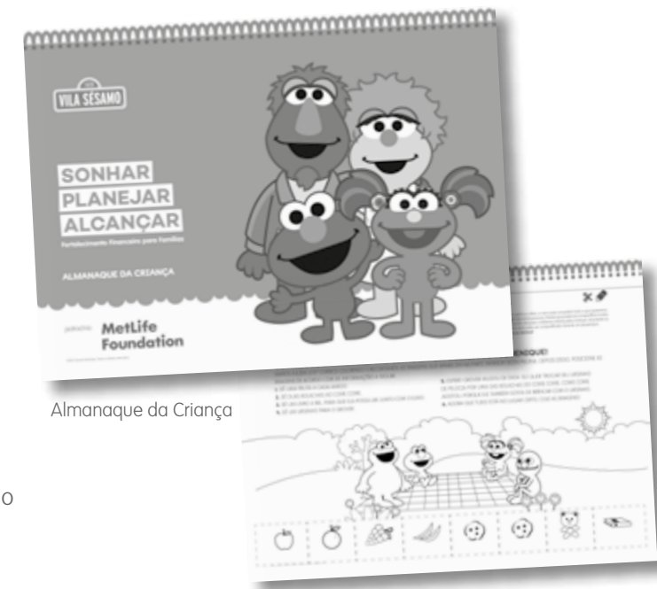
Almanaque da Criança

O almanaque reúne uma série de atividades para as crianças brincarem e se divertirem. Em cada página, há um desafio diferente que estimula o pensamento crítico e a criatividade da criança para alcançar sonhos. No cabeçalho de cada página, há dicas para os cuidadores estimularem reflexões com as crianças, sempre relacionando o conteúdo da atividade ao cotidiano delas.